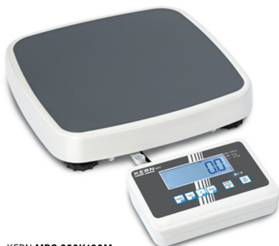
KERN MPC 250K100M

Kompakte Personenwaage mit Eich- und Medizinzulassung für den professionellen Einsatz in der medizinischen Diagnostik