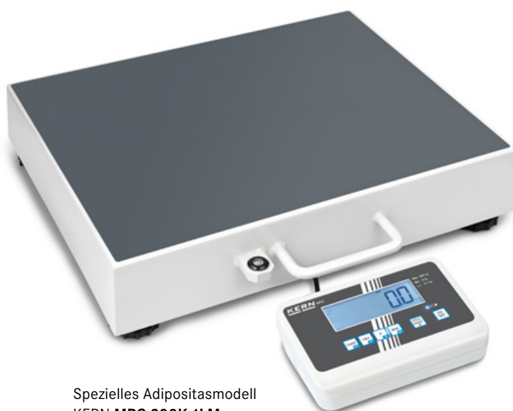
Spezielles Adipositasmodell KERN MPC 300K-1LM