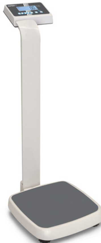
KERN MPE-P mit Stativ