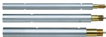
Hosszabbítók a mély furatok méréséhez (külön tartozék)