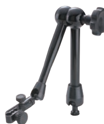
56AAK793 Mechanikus rögzítés Méret: lásd 7033B