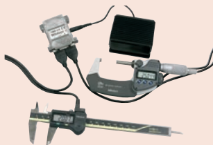
Minta alkalmazás lábkapcsolóval (opcionális kiegészítő)