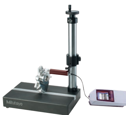
178-029 (SJ-210 készülékkel)