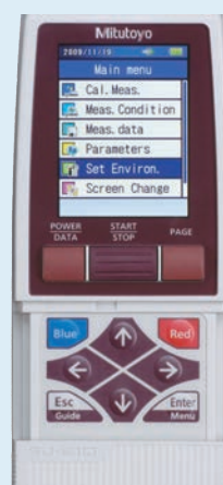
Billentyű védő fedél nyitva

*12AAA221 szükséges az SJ-210 / SJ-310-hez